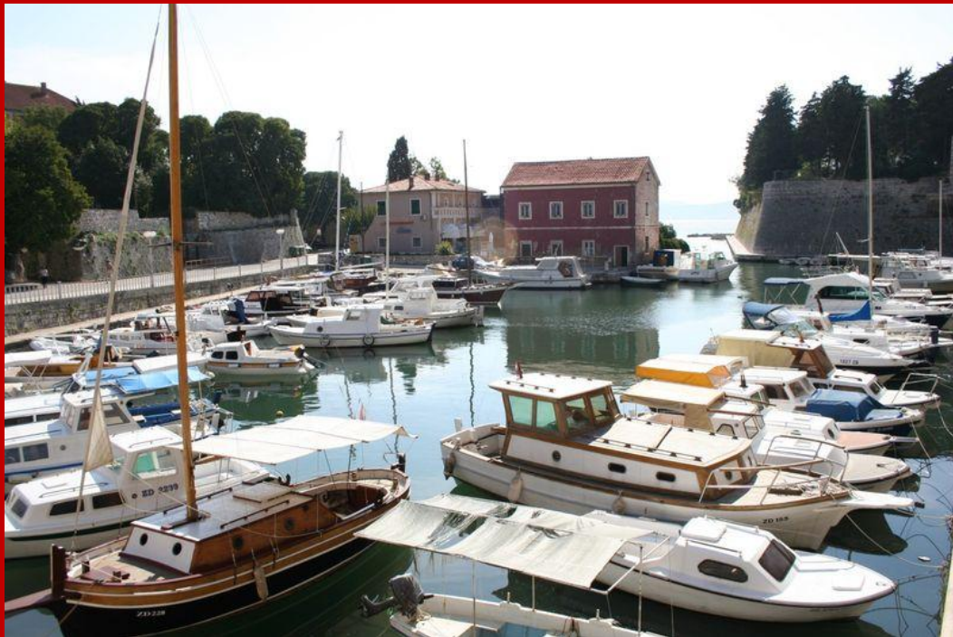
La "Fossa" al lato delle Mura veneziane