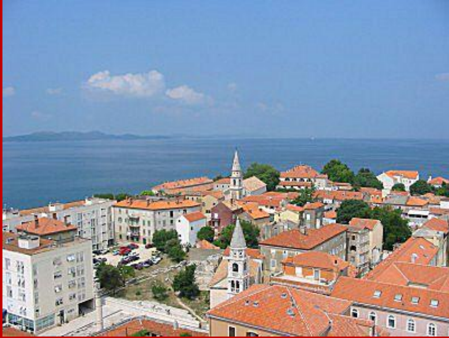
Veduta panoramica della città