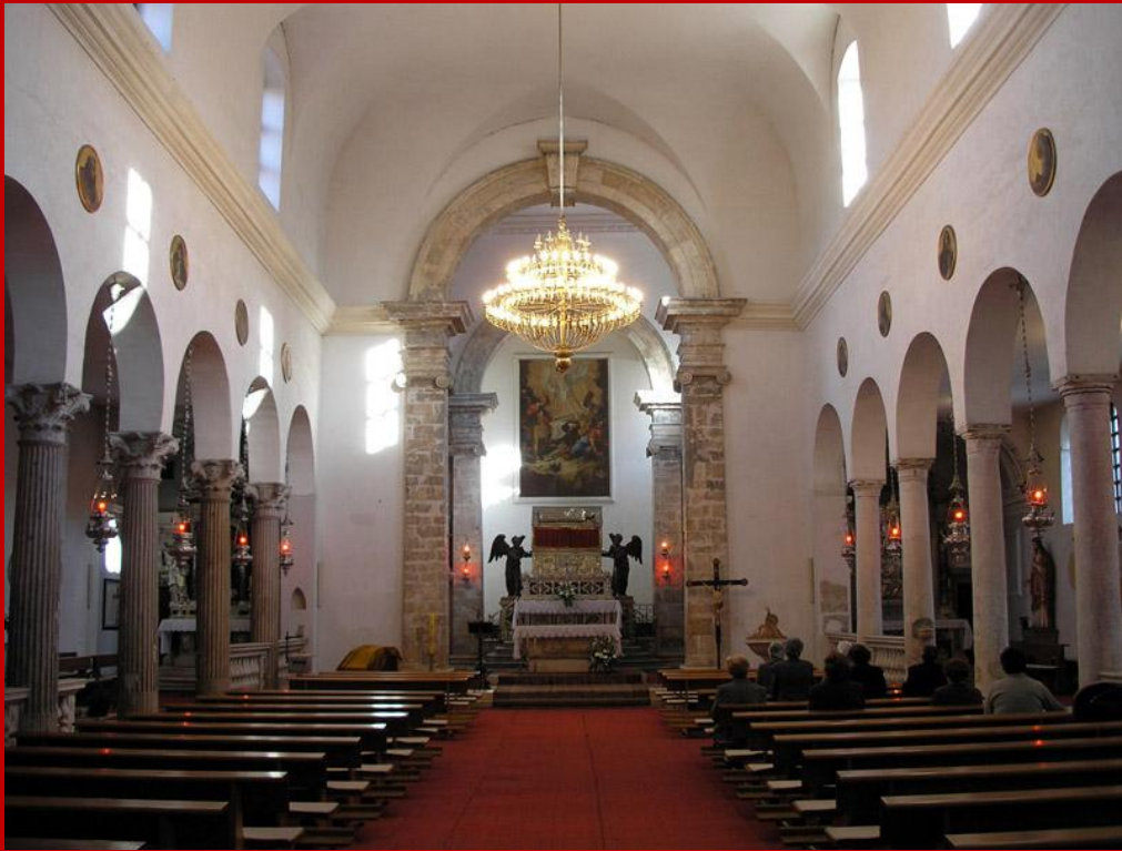
Navata centrale della Chiesa San Simeone