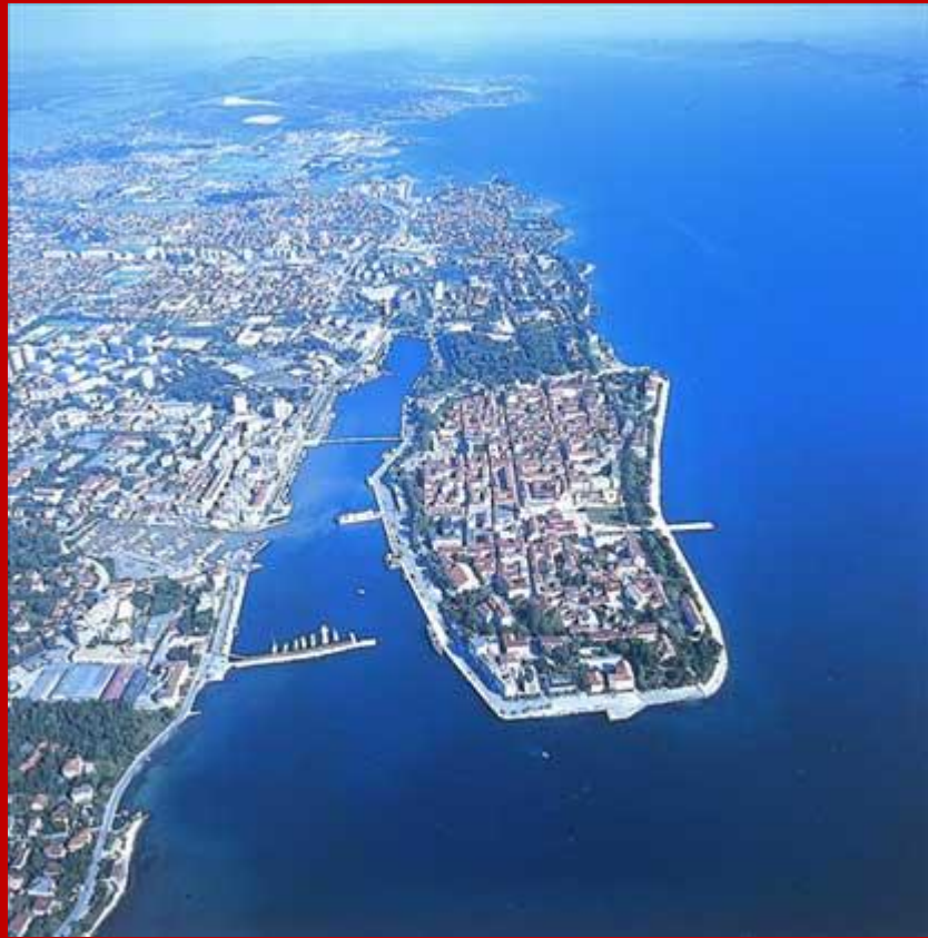
Zara vista dall'alto