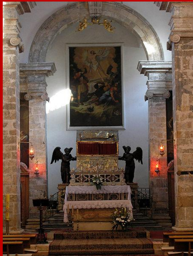
Altare della Chiesa San Simeone