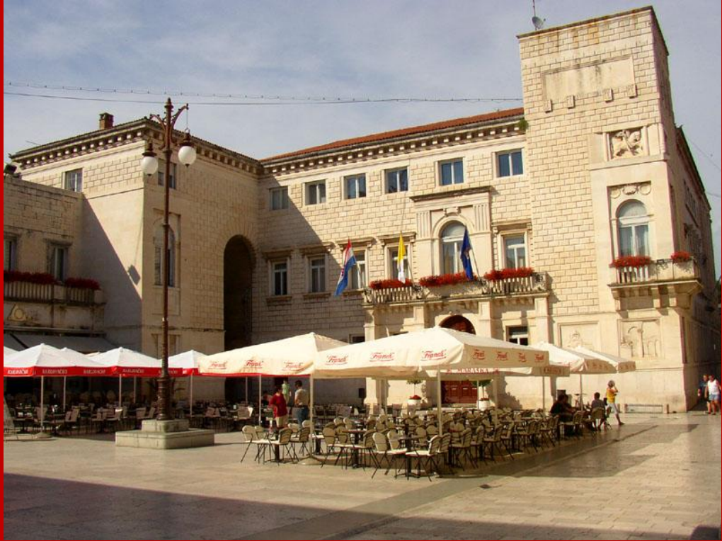
Municipio, costruito negli anni venti in stile "bugnato"