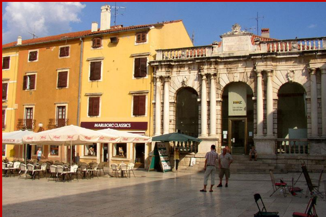
Piazzetta vicino al Forum