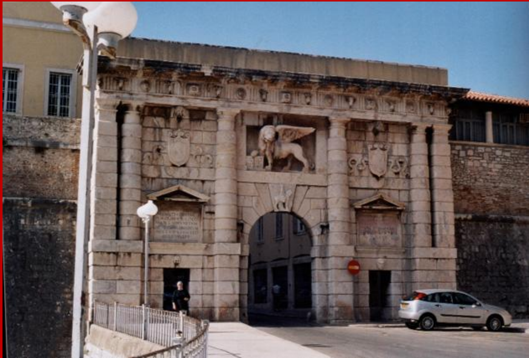
Porta Terraferma, veneziana