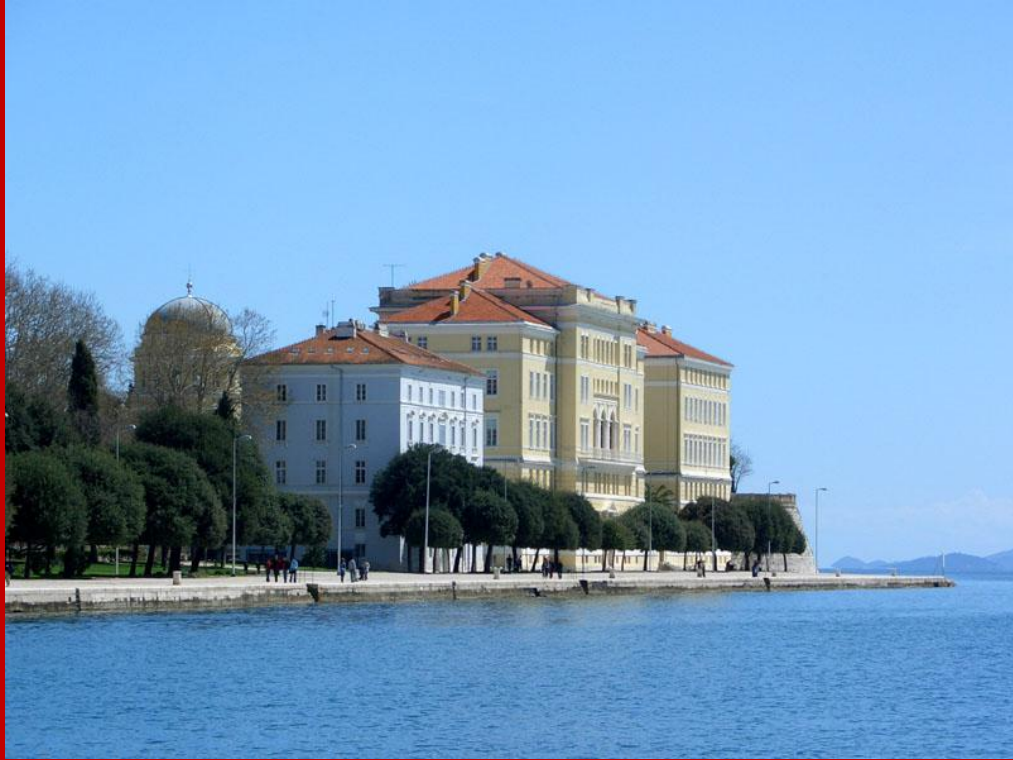
Lungomare con edificio Università