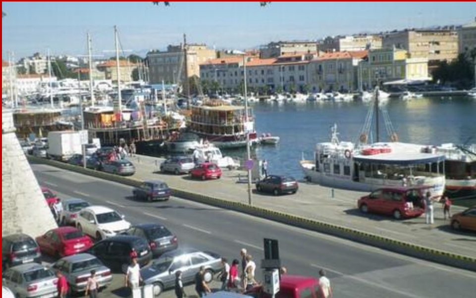
Vista del porto