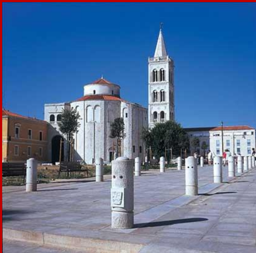
Forum Romano e Chiesa di San Donato